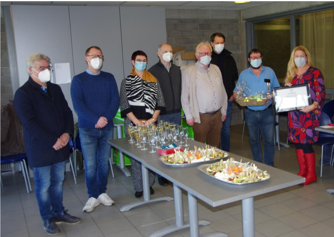
De huldiging werd afgesloten met een receptie aangeboden door de club. De huldiging kreeg ook aandacht in de pers. In ondermeer Het Laatste Nieuws, Het